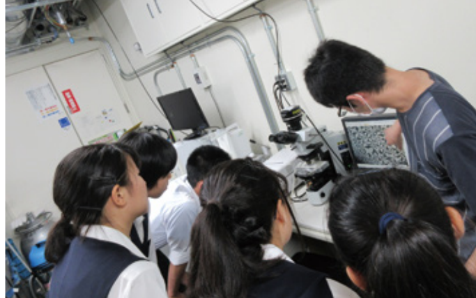
3年前に高校生を招いた授業の様子。全国から生徒を招いて液晶についての授業を行い、研究室の見学も行った。

わち、専門の違う研究者の出会いが世界を変えたのです。これがなければ、このような小さいスマートフォンはできていないといっても過言ではありません。